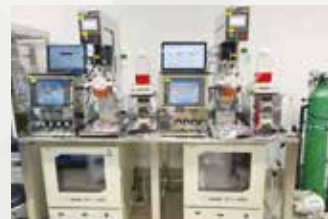
ヘリオス独自の自動化3D培養装置