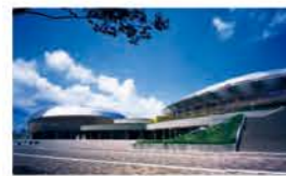
アクアドームくまもと