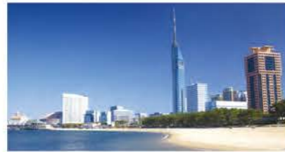
シーサイドももち海浜公園