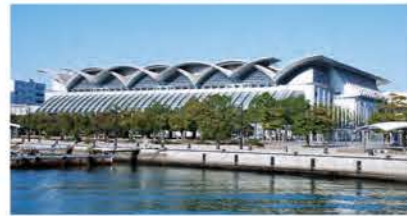
マリンメッセ福岡A館