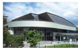
総合西市民プール