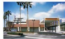
鴨池公園水泳プール